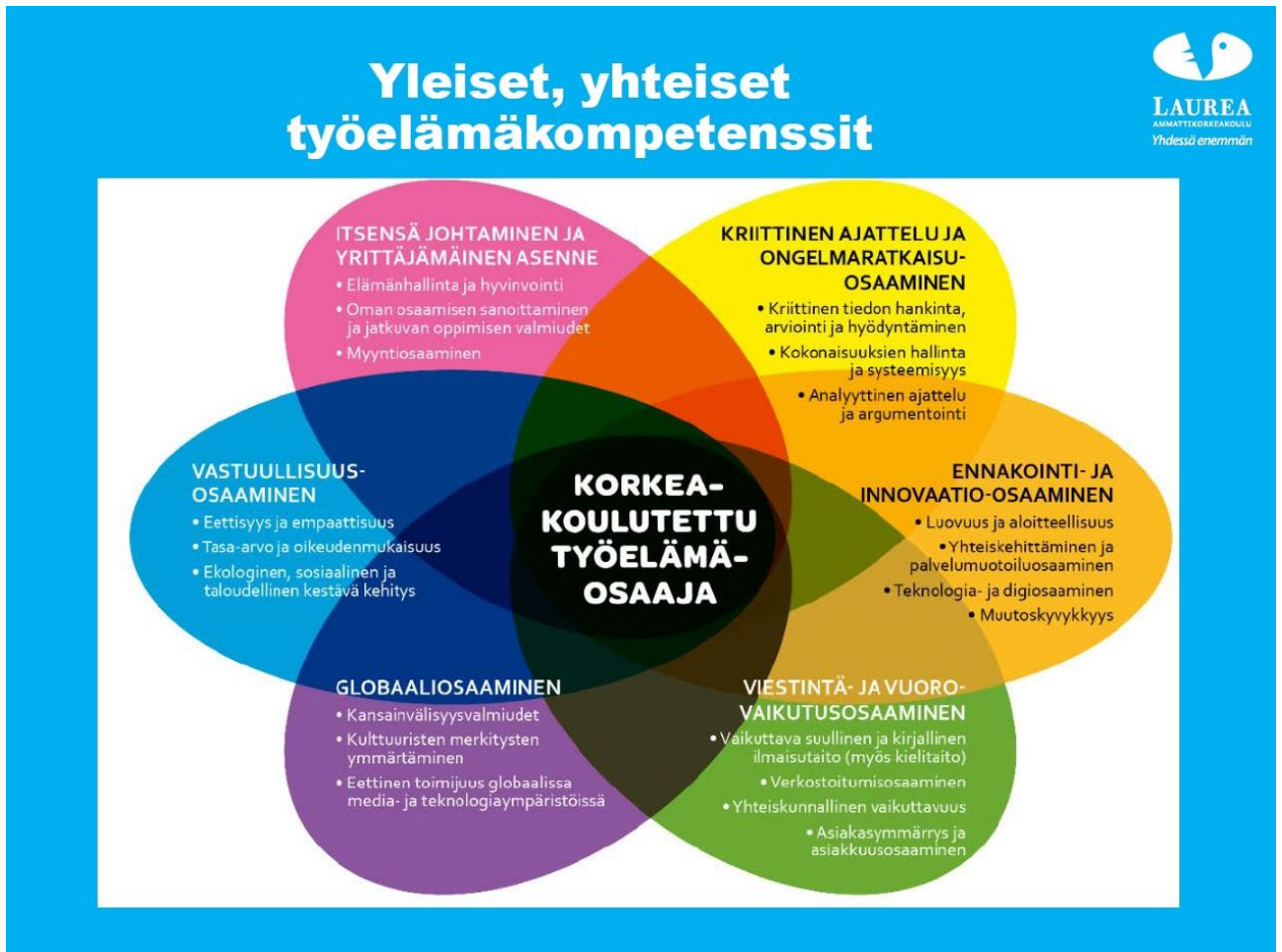
Kuva 1. Yleiset, kaikille tutkinnoille yhteiset työelämävalmiudet.

Koulutus tähtää laaja-alaiseen ja vahvaan ammatilliseen osaamiseen. Työelämälähtöisissä hankkeissa kehität myös yleisiä työelämävalmiuksiasi (ks. kuva 1). Tutkinnon suorittaneella on valmiudet seurata ja edistää oman ammattialansa kehittymistä sekä edellytykset oman ammattitaidon jatkuvaan kehittämiseen. Koulutus antaa riittävän viestintä- ja kielitaidon oman alan tehtäviin sekä kansainväliseen toimintaan ja yhteistyöhön.